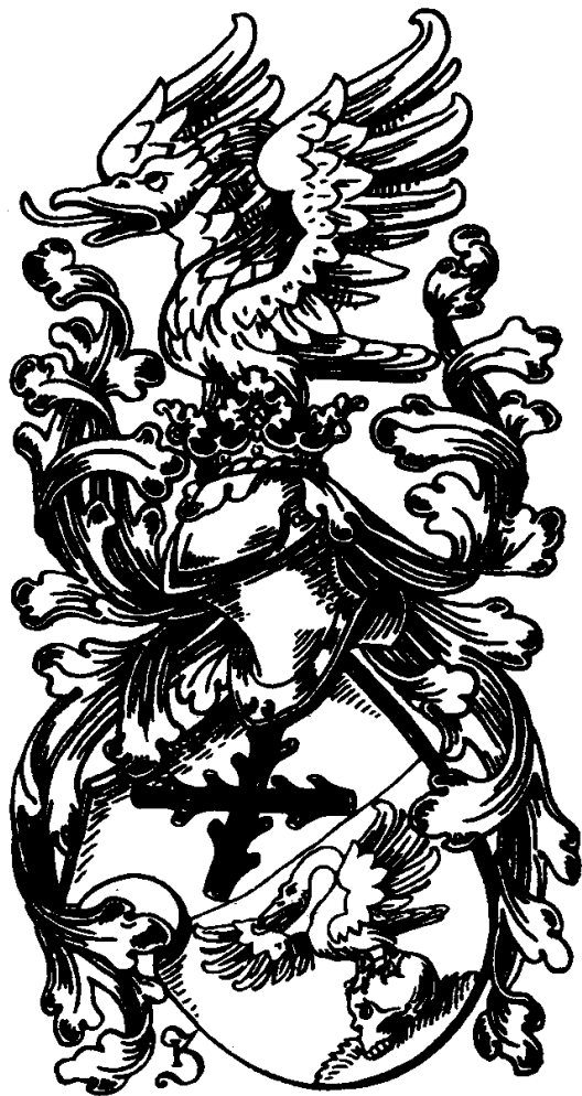
Obr. 11. Znak Krušinů ze Švamberka.

Tento Bohuslav, syn Hynkův, odešel pryč z vlasti za krále Jiřího pro útisky, jež bylo zakoušeti vyznavačům pod jednou,