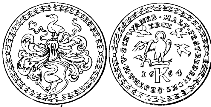
Obr. 12. Pamětní peníz Švamberský.

Je stříbrný pozlacený, má něco víc než palec v průměru. Na jedné straně je na malém štítu labuť, nade štítem přilba s fábory a nade přilbou zase labuť. Strana druhá ukazuje výra sedícího na větvi, kol něhož obletuje pět ptáčků (tři a dva); pod výrem je velké K a letopočet 1564 , kol toho všeho po kraji nápis: »Halt fest, bedencks best. H. A. H. Schwanberck.«